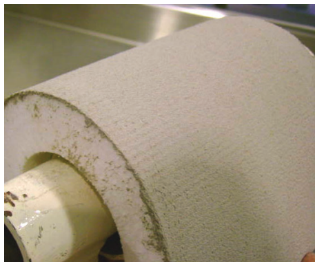
Prueba de Resistencia a la Flexión sin Agrietamiento